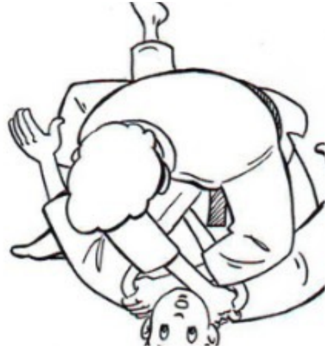
NAMI JUJI JIME