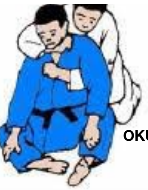
OKURI ERI JIME